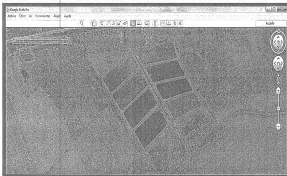
IMAGEN DE GOOGLE EARTH DE 22/12/2016